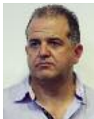
CONCEJAL Ricardo Ocaña PSN-PSOE