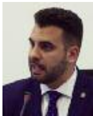
ALCALDE Jon Gondán GEROA BAI