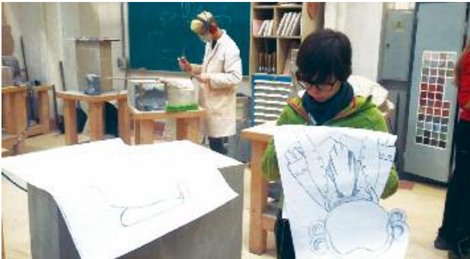
Imágenes del taller de la Escuela de Arte de Pamplona en el que se han trabajado las esculturas.