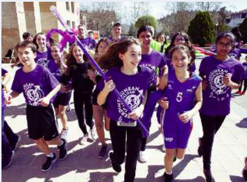
Carrera por la Igualdad. La mañana del 23 de marzo se celebró en el Parque Erreniega una carrera a favor de la igualdad organizada por el alumnado del IES Zizur y el Servicio de Igualdad, dentro de la programación del Día Internacional de la Mujer, que este año se celebró con el lema "Ahora más que nunca, impulso feminista, ni un paso atrás" / Orain inoiz baino gehiago, bultzada feminista, atzerapausorik ez". ■