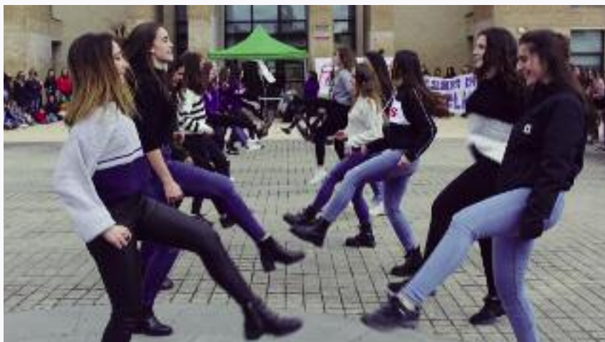
Una llamada a la igualdad. El parque Erreniega fue el punto de reunión el pasado 8 de marzo para los vecinos y vecinas que respondieron a la convocatoria de las alumnas del instituto Erreniega para reivindicar una sociedad más igualitaria y más justa. ■

Los criterios sociales deberán suponer al menos un 10% del baremo y en concreto los de género al menos un 5% del total. Las personas beneficiarias de las subvenciones deberán acreditar debidamente el cumplimiento de los criterios sociales establecidos en cada caso.