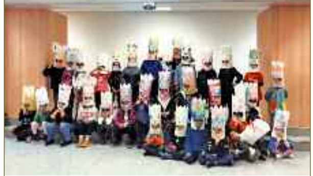
Taller de kilikis.