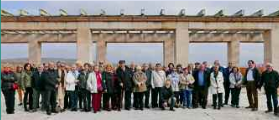
Imagen del viaje del Club de Jubilados y Jubiladas a La Rioja.