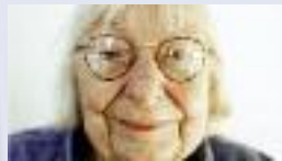
Jane Jacobs (1916-2006) fue una divulgadora científica, teórica del urbanismo y activista sociopolítica canadiense.

El Servicio Municipal de Igualdad ha organizado un "Paseo con gafas lilas" por Zizur Mayor" para el día 16 de junio de 11:00 a 13:00. Esta iniciativa, que se repite en ciudades de todo el mundo bajo el título de "Paseo de Jane", homenajea a la activista y