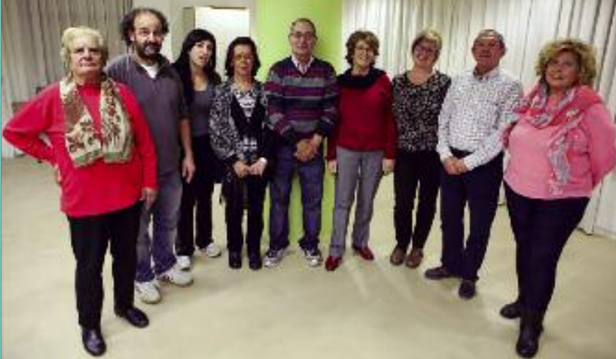
Grupo de teatro del Club de personas jubiladas Tejemanaje.