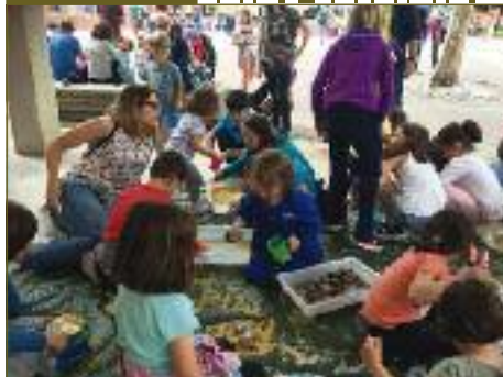
La Ludoteca participó en la fiesta de las 3 escuelas con un taller sensorial.

Udako ordutegia. Ametxea gazte lokala itxita egonen da ekainaren 30etik uztailaren 15era. Uztailaren 16tik aurrera, eta Zizur Nagusiko jaiak pasatu arte, astelehenetik ostiralera egonen da zabalik, 9:00etatik 14:00etara, eta arratsalde, astelehenetan, 16:00etatik 20:00etara eta, ostiraletan, 16:00etatik 21:00etara. ■