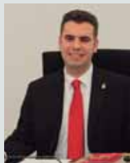
ALCALDE Jon Gondán GEROA BAI