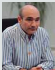
CONCEJAL José Angel Saiz EH BILDU