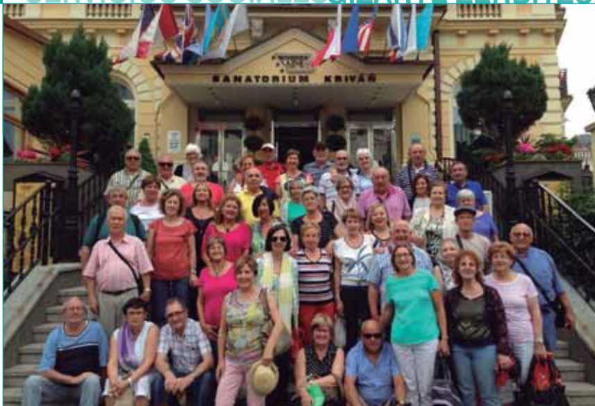
Grupo de jubilados y jubiladas de Zizur Mayor en Karlovy Bary, ciudad balneario de Bohemia, región occidental de la República Checa.