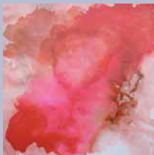
Obra de Belén Arévalo.