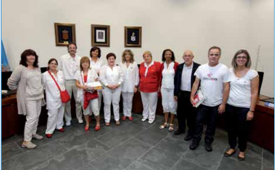
Representantes del Servicio de Deportes, de los centros educativos y de la plantilla municipal tras recibir el galardón la víspera de Fiestas.