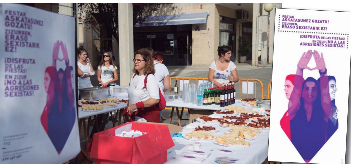
Stand junto al Ayuntamiento en el que se repartieron guías, pines, pegatinas y pinchos la víspera de fiestas.

El Servicio de Igualdad y los grupos Zizurko Talde Feminista y Mujeres Libres han desarrollado en septiembre una intensa campaña contra las agresiones sexistas que ha incluido talleres de autodefensa, un protocolo de actuación, la distribución de una guía de recursos, carteles y lonas en espacios festivos y una mesa informativa con almuerzo el día del chupinazo (en la imagen).