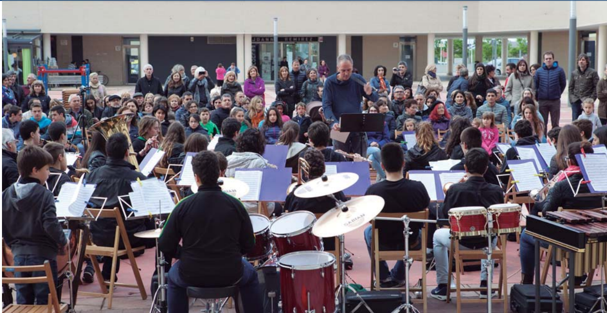
LA ESCUELA DE MÚSICA CELEBRÓ EL PASADO 13 DE MAYO SU 30 ANIVERSARIO CON UN GRAN CONCIERTO EN LA PLAZA DE LA MUJER Y UNA TARDE DE PUERTAS ABIERTAS EN LA QUE ENSEÑÓ SUS INSTALACIONES Y OFERTA ACADÉMICA A LA CIUDADANÍA