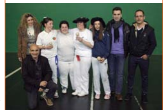
Pelotaris de Bizkaia y Navarra que disputaron la final del campeonato de pelota mano femenino el 12 de marzo en Zizur Mayor.

El trabajo del Club de Pelota Ardoi Elkartea en la promoción de la pelota fue reconocido en la primera Gala de la Pelota Navarra organizada por Elkarpetola el pasado 1 de junio.