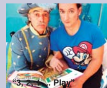
"3, 2, 1... Play"