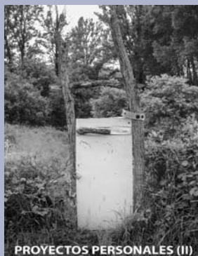
PROYECTOS PERSONALES (II)