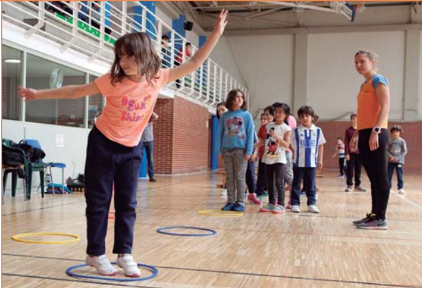
Exhibición de Deporte amigo (arriba) y psicomotricidad (abajo).