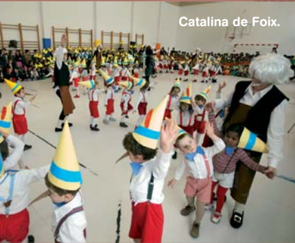
Catalina de Foix.

El pasado 4 de febrero, el alumnado y profesorado se reunió en el patio del instituto para celebrar Santa Águeda. Además de las coplas tradicionales, los chavales cantaron coplas creadas por ellos mismos y acompañadas del sonido del txistu y del tamboril. Las creaciones fueron obra de cuatro grupos de 1º de Educación Secundaria modelo D y de alumnos de 1º de Bachiller de la asignatura "Recursos para la comunicación".