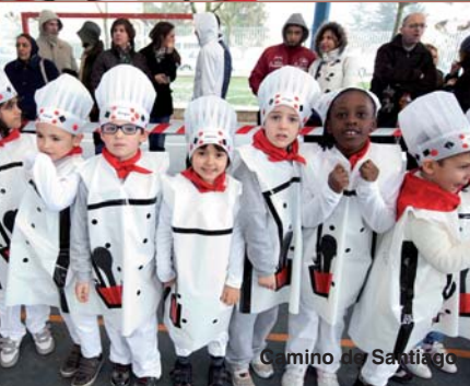
Camino de Santiago