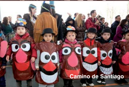
Camino de Santiago