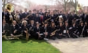
Banda de Música de Zizur Mayor